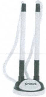
Bút nhựa gắn bàn

(đã có thiết kế trong Bộ hướng dẫn sử dụng nhận diện thương hiệu PGBank)