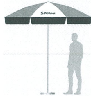
Ô che (ô quảng cáo to)

(đã có thiết kế trong Bộ hướng dẫn sử dụng nhận diện thương hiệu PGBank)